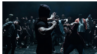
Clément COGITORE - Les Indes galantes - 2017 Vidéo - 6 min - Edition 3/5 Collection FRAC Auvergne

Laure Forlay, chargée des publics au FRAC Auvergne Co-commissaire de l'exposition avec Jean-Charles Vergne