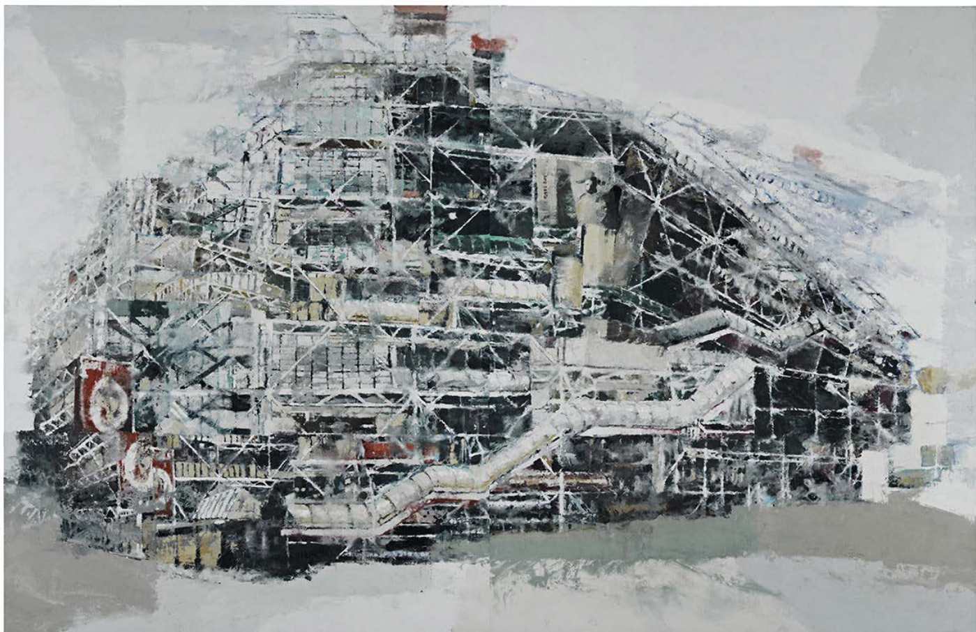
Philippe COGNÉE - Beaubourg - 2014 Encaustique sur toile marouflée sur bois - 200 x 300 cm Collection FRAC Auvergne