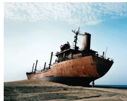
Zineb SEDIRA - The Death of a Journey 5 - 2008 C-print contrecollé sur aluminium - 100x124,8 cm - Dépôt du Cnap au FRAC Auvergne en 2014