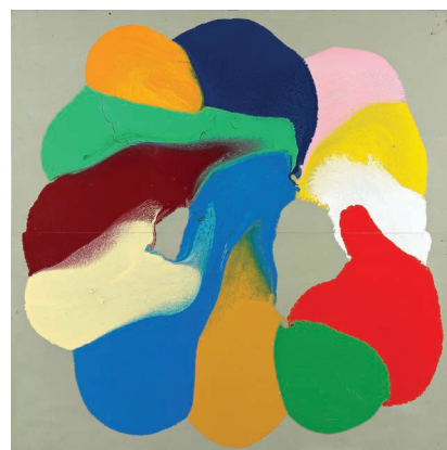
Damien CABANES - Sans titre - 1991 Laque sur bois - 200 x 200 cm Collection FRAC Auvergne