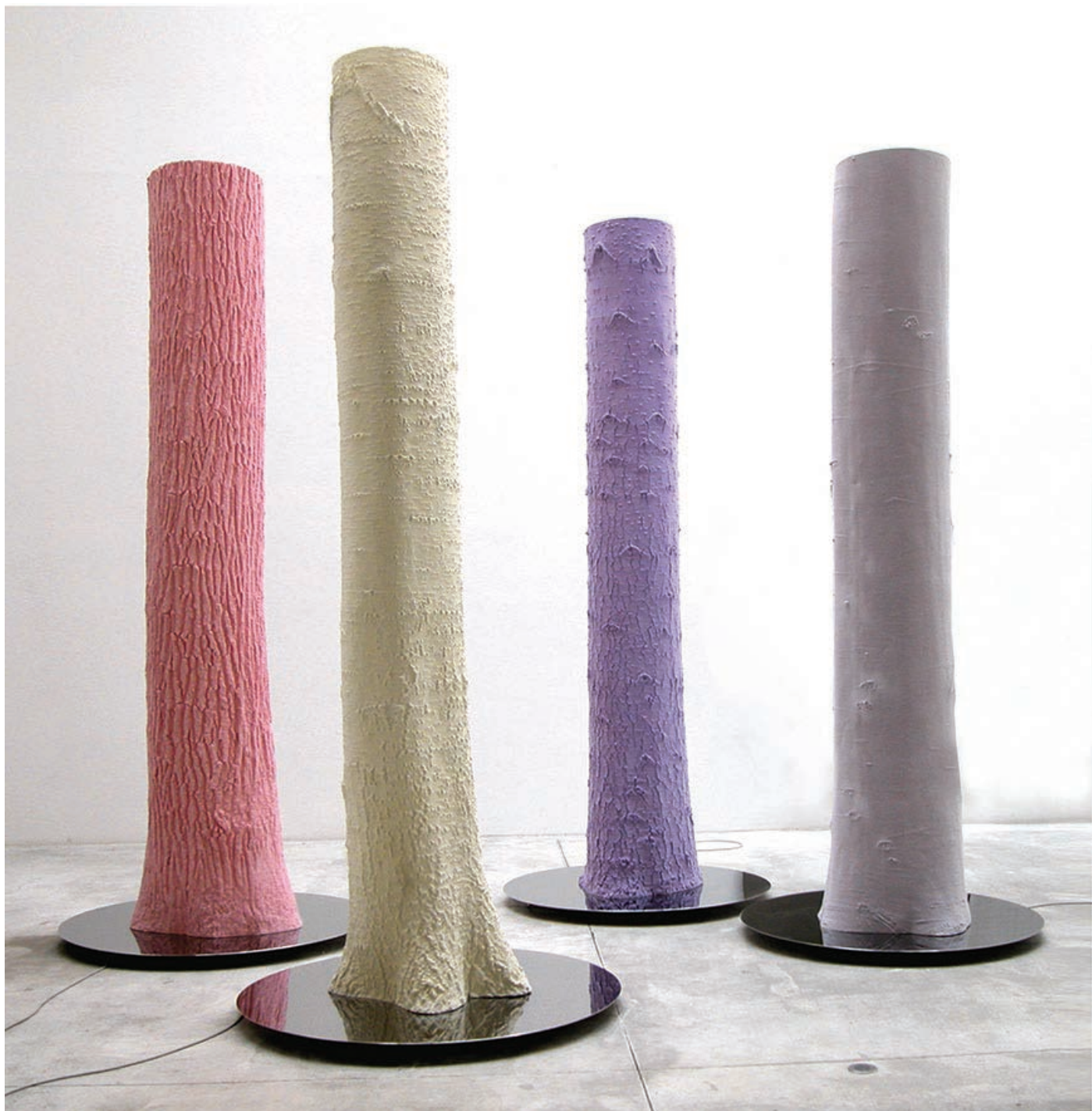
Didier MARCEL - Sans titre - 2002 Résine, acrylique, acier - 4 x (300 x 120 cm) Collection FRAC Auvergne